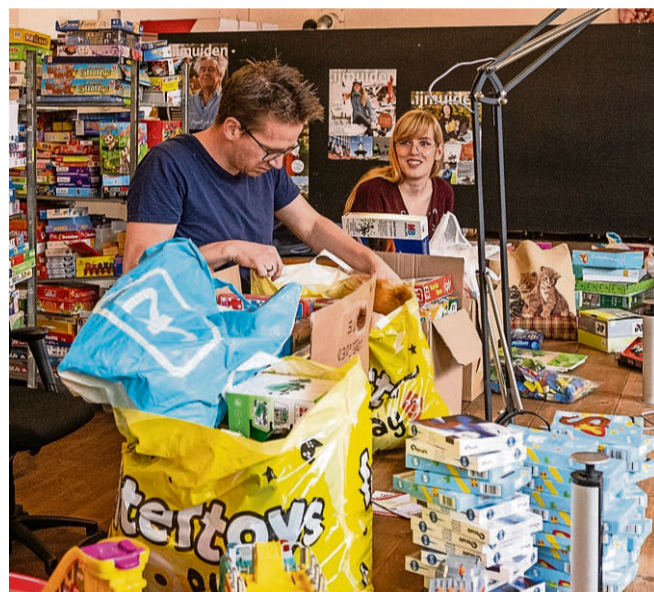
Ijmuiden - Speelgoed inzamelen in de kerk van Ijmuiden Marketing