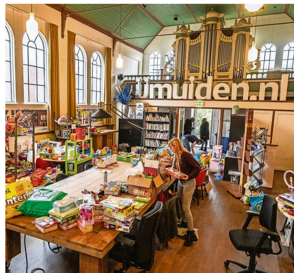
Ijmuiden - Speelgoed inzamelen in de kerk van Ijmuiden Marketing

Rechtenvoorbehoud: Alle rechten t.a.v. deze uitgave worden uitdrukkelijk voorbehouden en berusten bij Mediahuis Nederland B.V. Op het gebruik van deze uitgave is het bepaalde in de algemene gebruiksvoorwaarden van Mediahuis Nederland van toepassing: mediahuis.nl/gebruiksvoorwaarden. © 2023 Mediahuis Nederland B.V.