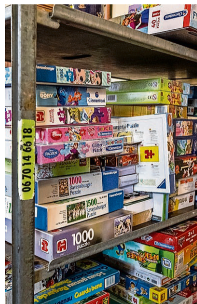
Ijmuiden - Speelgoed inzamelen in de kerk van Ijmuiden Marketing